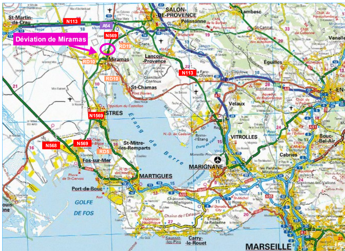
Illustration : DRE PACA/ MIC © ign scan 250