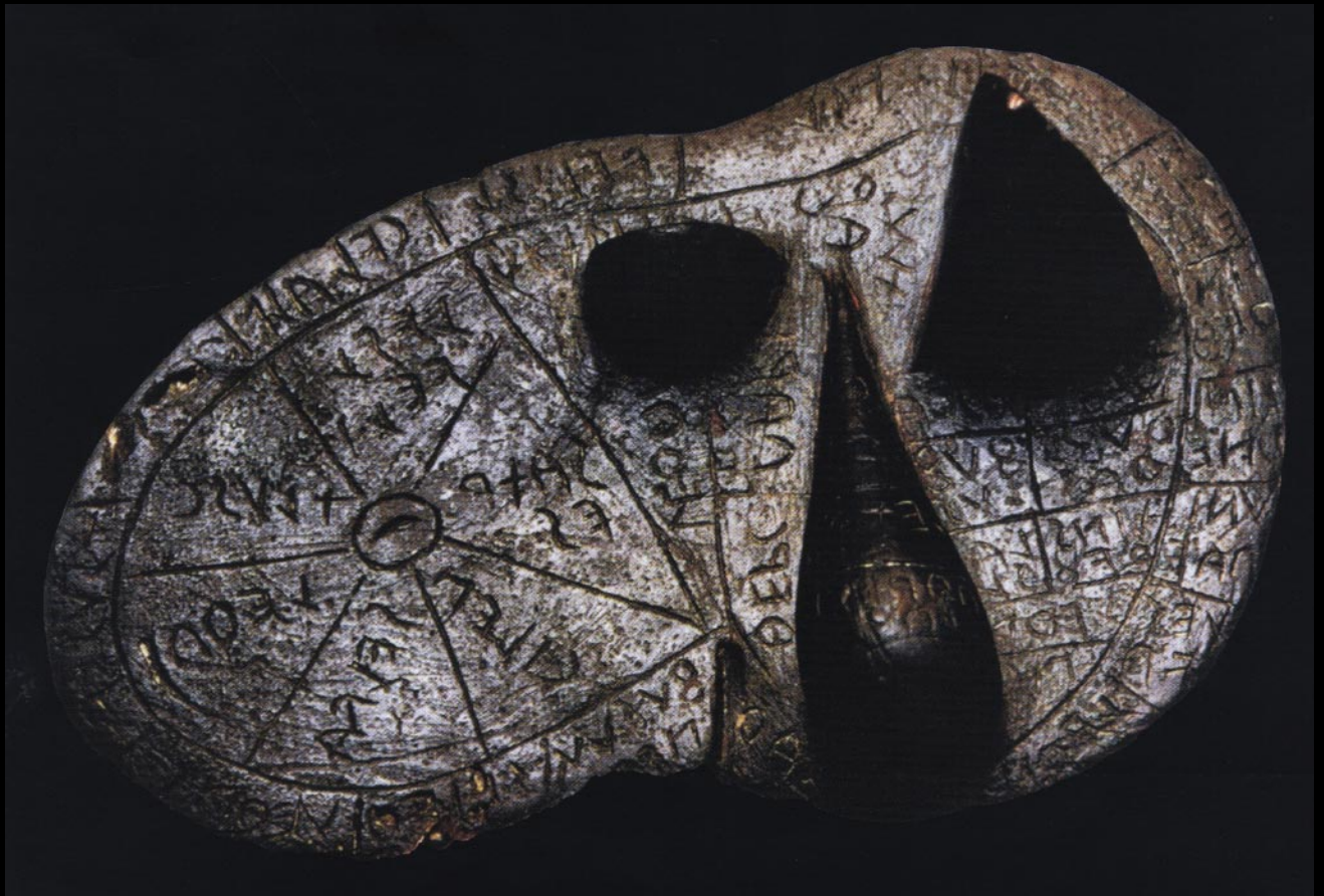
Fig.86. Ficat etrusc de bronz, găsit la Piacenza, împărțit în 45 de sectoare, fiecare din ele având un nume de divinitate.