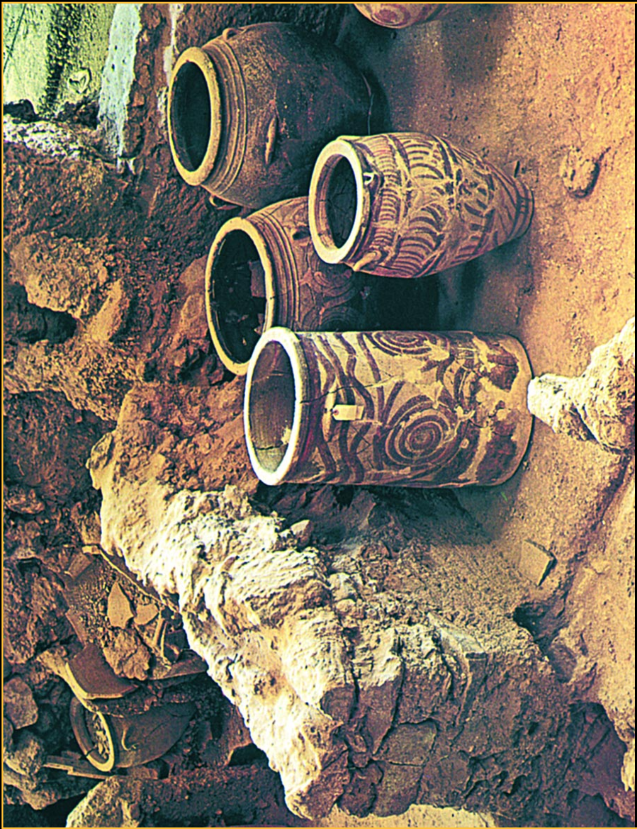
Fig.94. Sub cenușa vulcanică, în micuța insulă Tera (Santorini), din Marea Tracică (Egee), găsim anfore decorate cu Spirala Pelasgică, cu aproape 1000 de ani înainte de sosirea grecilor în Europa.