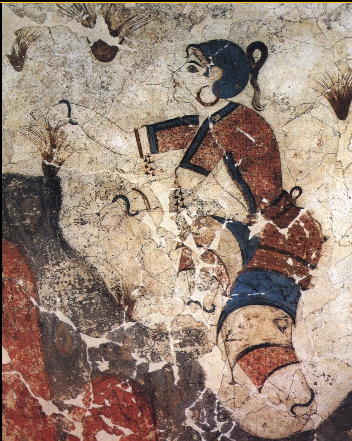
Fig.97. „Doamna“ de pe unul dintre pereții pictați, a fost găsită în așa-zisa „Casa Doamnelor“; este de mărime naturală, având un păr negru, foarte s sofisticat strâns sub un acoperământ albastru, lăsând totuși să-i cadă pe frunte o șuviță rebelă, iar la spate o

„coadă de cal“, ingenios și elegant aranjată. Cerceii de aur și buzele rujate te împiedică să gândești că aceasta era moda, atunci, la „atlante“, acum mai bine de 4-5000 de ani. Îmi pare rău că spațiul nu-mi permite să vă arăt și alte „frumoase“ ale acelor vremuri. Kimonoul pe care-l poartă are partea de sus aproape identică cu haina lui Mircea cel Bătrân, vezi Fig. 49. După The Wall-painting of Thera , Alex & Christos Doumas, The Thera Foundation, Athens, 1992