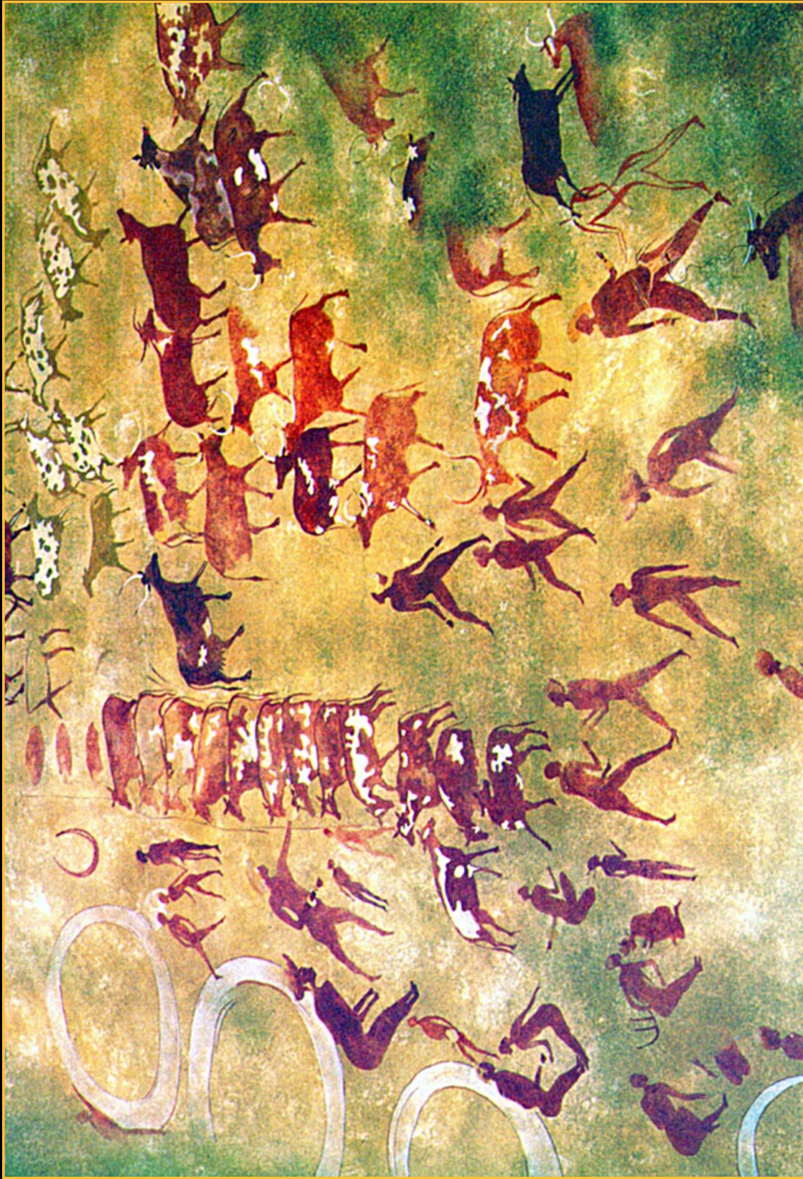
Fig.93. În anul 1958 exploratorul francez Henri Lhote descrie o serie de stânci, pictate superb, în ... Sahara. Astfel putem vedea vânători și păstori, albi și negri, cât și cirezi de vaci cu niște coarne lungi păscând pe văile fertile și abundând în vegetație ale Saharei.