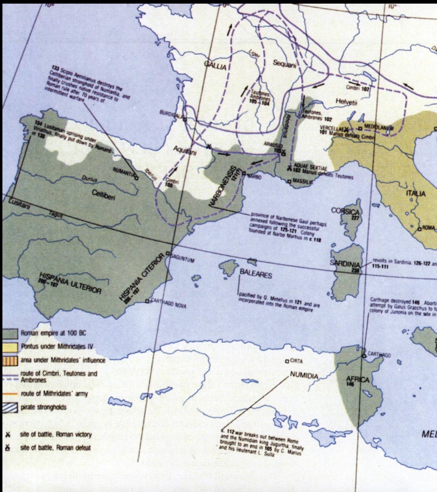
Fig.83. Europa la anul 100 î.d.H., ni se arăta încă dominată de daci; să nu uităm că Burebista își apăra granițele pe malul lacului Constanța (Elveția de azi). La sud de Dunăre romanii ne ocupaseră Macedonia, fără să ne schimbe numele. Grecii erau cunoscuți ca achei și trăiau liniștiți în sudul Peninsulei Balcanice sub romani. Europa începea să fie bântuită de triburi barbare germanice, și vor mai trebui să treacă secole până când acestea ne

vor împinge afară din spațiul de 200 de ani până când, în urma unor din teritoriul Daciei; și vor mai sosi, și o ramură a lor ne va oc de azi etc.), separându-ne în de aromânii-macedoneni, meglene