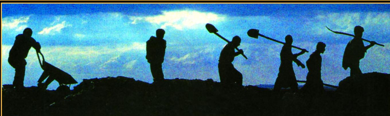
Fig.92. Arheologia nu se mai practică azi ca acum 200 de ani: „trei cu sapa, doi cu mapa și unul cu roaba“ decât atunci când nu vrei altfel. Azi se formează o echipă multidisciplinară, se folosesc detectoare sonice și chiar sateliți. Poate că este mai bine pentru România că se așteaptă o astfel de tehnologie, poate nu.