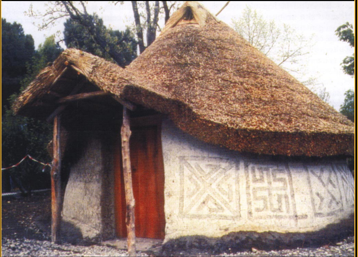
Fig.87. Casă etruscă, acoperită de simboluri și învăluită de misticism. Fig. 86-87 sunt reproduse după Etruscans: Italy Lovers of Life