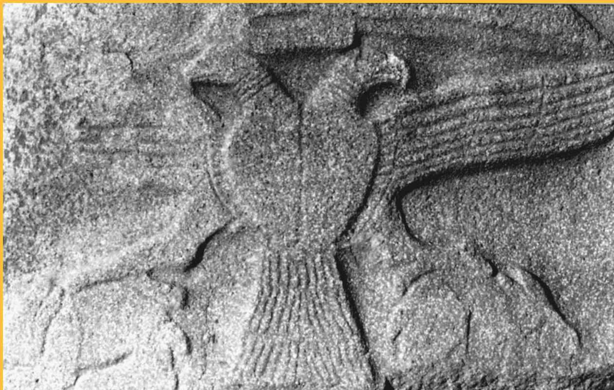
Fig.90. În Anatólia „se vedea dublu“, putem spune, și asta se datora predilecției evidente, pe sculpturi și basoreliefuli, pentru creaturi cu două capete. Vulturul hittit-carpato-dunărean cu două capete, unul privind spre Apus, altul spre Răsărit, idee ce va fi „împrumutată“, mai târziu, de Bizanț, Rusia, Polonia, Imperiul Austro-Ungar, Cehia, și cine mai știe de cine.