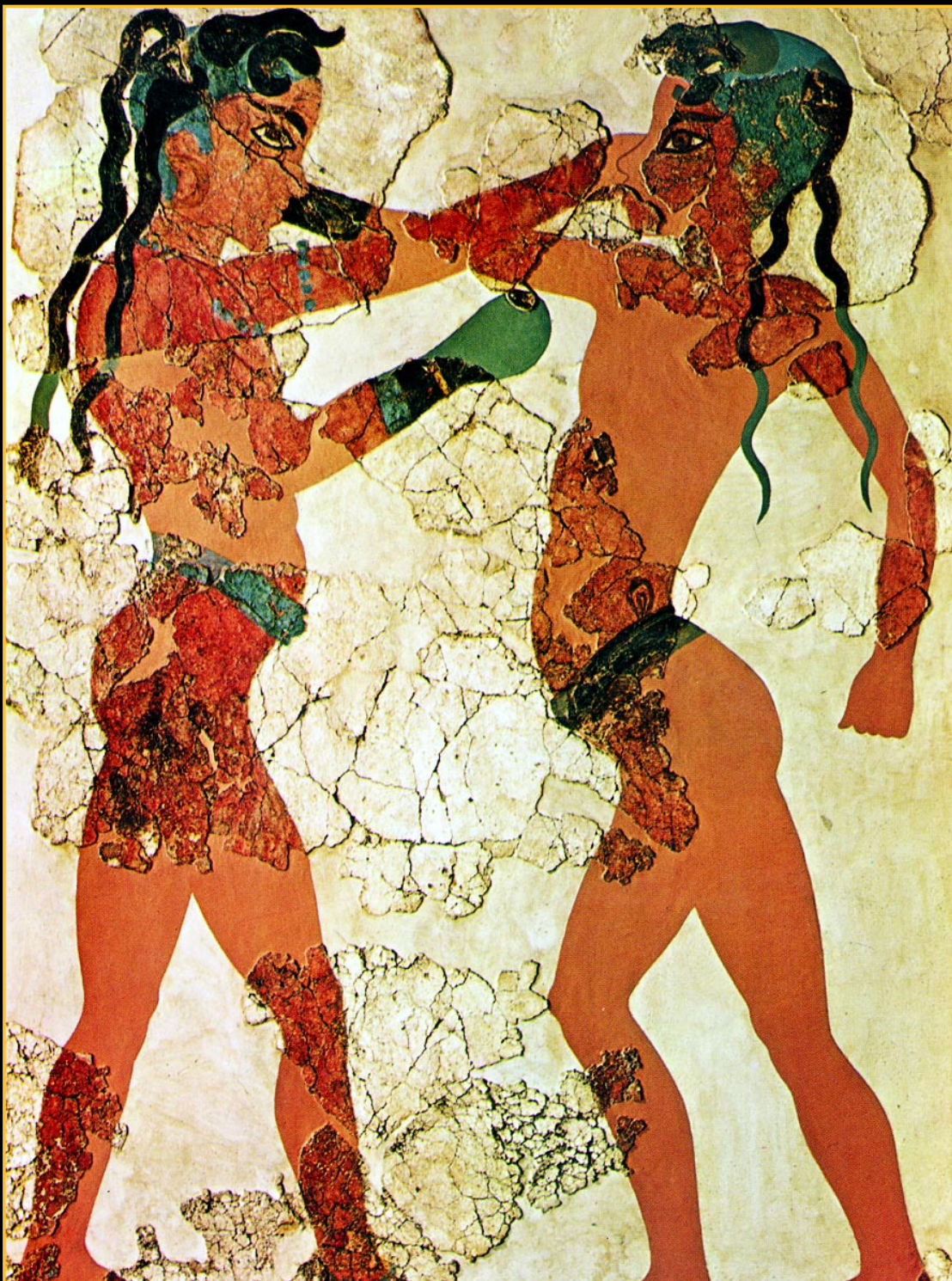
Fig.96. Pe unul din zidurile interioare ale unei case, chiar aproape de ușă, a fost pictată scena luptei dintre doi tineri, locuitori ai Terei-Santorini. Reprezintă de fapt cea mai veche imagine a doi boxeri. Părul lor este sofisticat aranjat, dovedind rafinament. Mulți îi consideră pe vechii locuitori ai Terei ca fiind acei atlanzi, descriși de

Platon, care vor dispărea în urma erupției vulcanice. Ce este ciudat, nu s-au găsit resturi omenești acoperite de lava vulcanică (ca la Pompei, de exemplu), dovedind că au putut părăsi locurile în timp. Unde s-au dus ei, răspândindu-și cultura, rămâne de dedus.