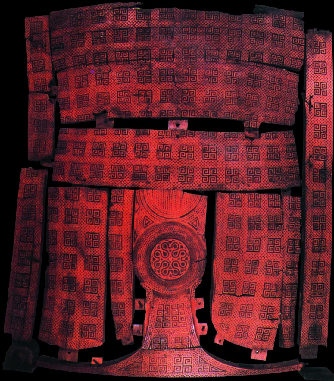
Fig.91. Crucea Pelasgică, simbol al vieții veșnice la carpato-dunăreni (cea mai veche a fost găsită pe teritoriul dacic sud-dunărean, în Bulgaria de azi, având o vechime de 8000 de ani) o găsim și la hitiții-carpato-dunăreni. Acest simbol va fi preluat și el de niște iresponsabili și transformat într-un simbol al intoleranței, cruzimii și sălbăticiiei, și asta într-o lume așa-zis civilizată.

Fig. 88-91 au fost luate din Anatolia: Cauldron of cultures, Lost civilizations , Editors of Time-Life Books, Alexandria, Virginia, 1995