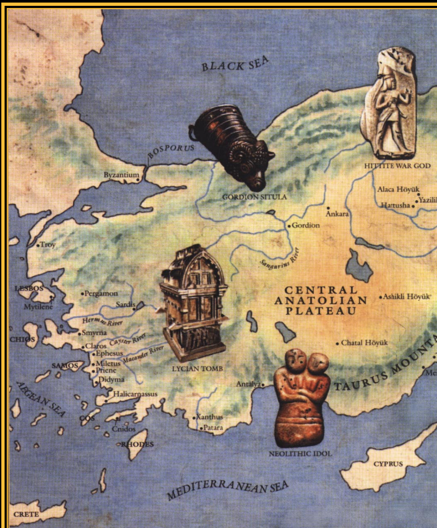
Fig.88-89. Anatolia, zona centrală a Turciei de azi, un fost Imperiu Carpato-Danubian. În vecinătate estică a Anatoliei se găsește spațiul dintre două celebre fluvii: Tigru și Eufrat unde va înflori civilizația sumeriană (de asemenea, carpato-dunăreană) și mesopotamiană.